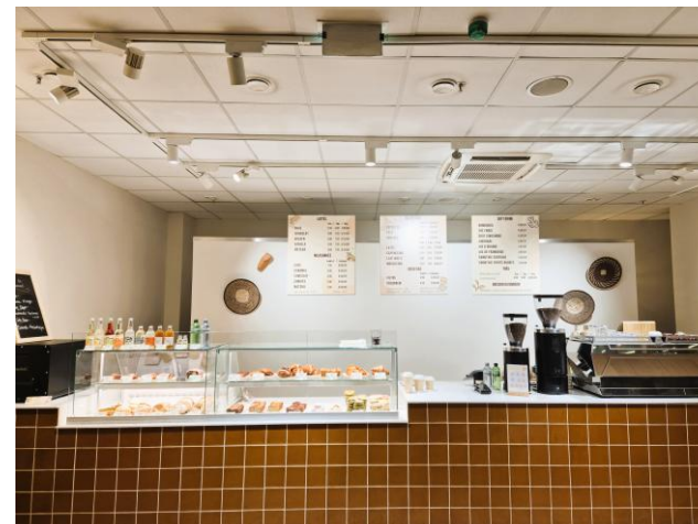
Blick von innen