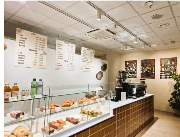
Blick von innen